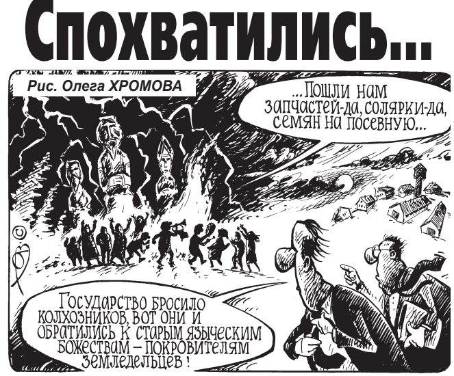
Рис. Олега ХРОМОВА. ...Пошли нам запчастей-да, солярки-да, семян на посевную...