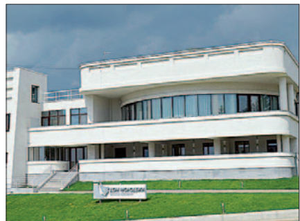
Дом молодёжи в селе Бессоновка

В открывшемся заново Доме молодёжи есть детское кафе, кондитерская-кофейня с летней верандой, ресторан, зал торжественных бракосочетаний, банкетный зал, детская комната аниматоров, билльярдная, мини-кинотеатр и т.д. В перспективе планируется открытие салона красоты и цветочного бутика. 35 лет назад его строили по индивидуальному проекту по инициативе председателя