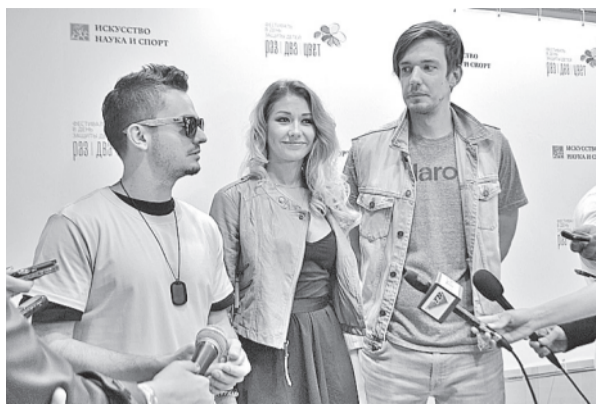
Группа «5sta Family».

В День защиты детей в Губкине, на стадионе спортивного комплекса «Горняк», прошел благотворительный фестиваль «РазДваЦвет», организатором которого выступил Благотворительный фонд Алишера Усманова «Искусство, наука и спорт». Перед зрителями, в числе которых были воспитанники разуменского, старооскольского, белгородского детских домов, а также подопечные губкинского, корочанского, чернянского социально-реабилитационных центров для несовершеннолетних, муниципального учреждения социального обслуживания системы социальной защиты населения Старооскольского городского округа «СРЦДН», выступили популярные и любимые артисты – группы «Vazil», «5sta Family» и Митя Фомин. Роли ведущих праздника блестяще исполнили участники известной команды КВН из Белгорода «Детективное агентство «Лунный свет».