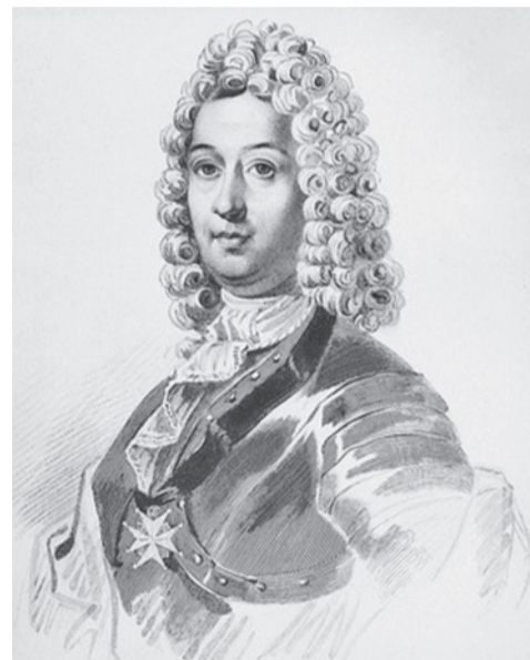
Фельдмаршал Борис Петрович Шереметев, по воспоминаниям современников, отличался особым «внутренним благородством». Принадлежит к древнему роду, он уважал традиции своих предков, богатое наследие Московской Руси.