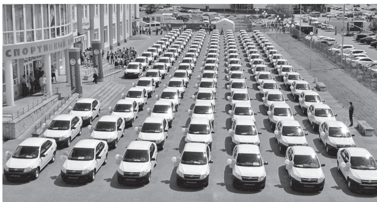
15 млн рублей составил призовой фонд Всероссийской премии «Родительский рекорд-2016». Каждая семья-победительница получила по 3 750 000 рублей.

Здорово, что в двух следующих номинациях победителями стали семьи наших земляков. Так, «Самой многодетной семьёй Белгородской