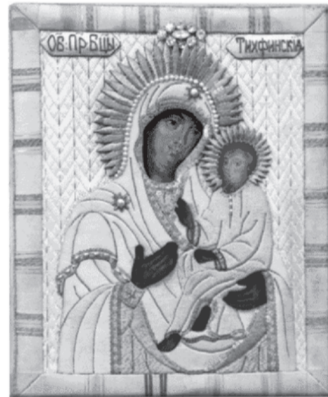
Чудотворная Тихвинская икона Божией Матери (в настоящее время находится в Свято-Михайловском храме поселка Борисовка).