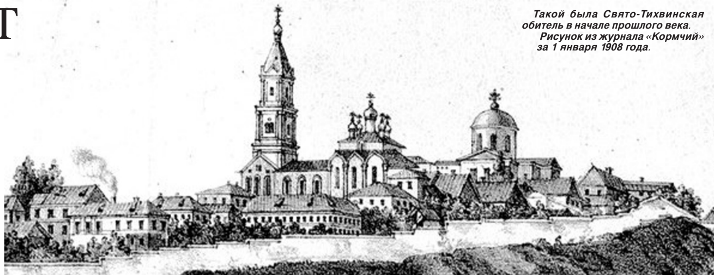
Такой была Свято-Тихвинская обитель в начале прошлого века. Рисунок из журнала «Кормчий» за 1 января 1908 года.