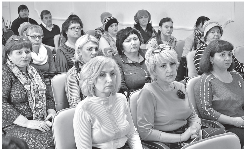
Участники «круглого стола»