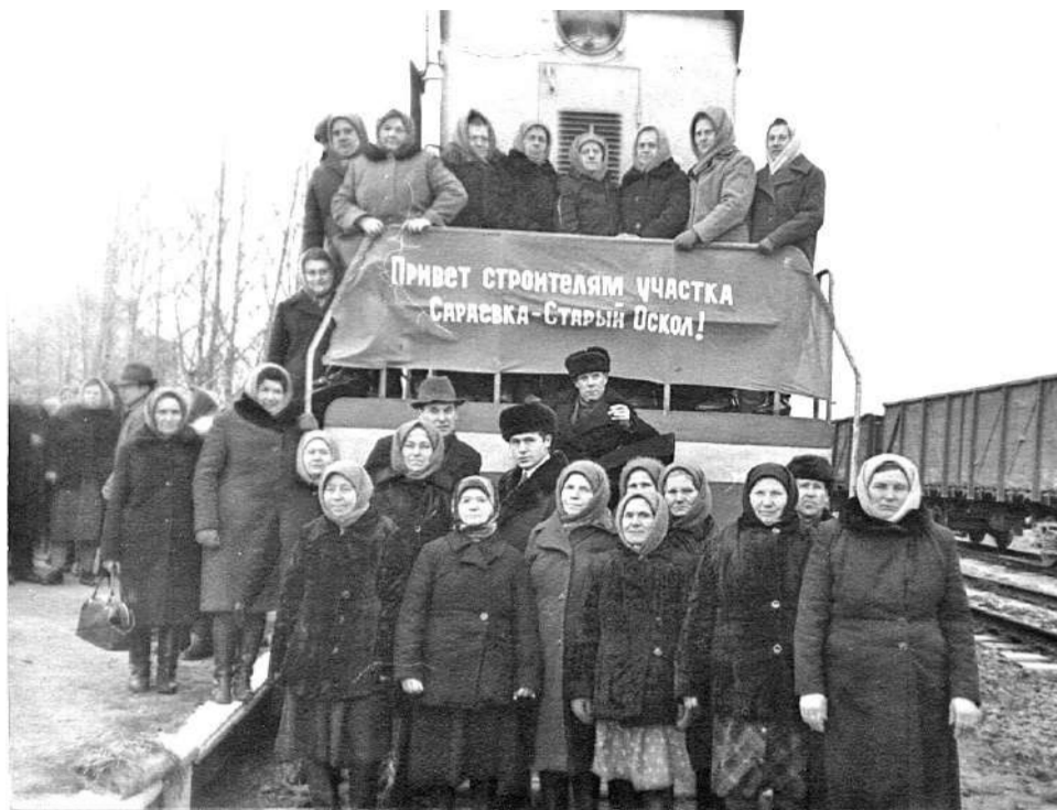
Участницы строительства железной дороги Старый Оскол – Ржава. 1975 г.