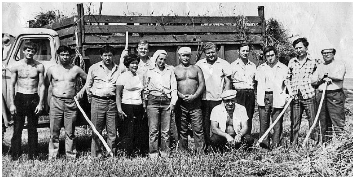
Члены Губкинского райкома КПСС и райкома ВЛКСМ на уборке сена в колхозе «Ленинское знамя», с. Осколец, 1982 г.