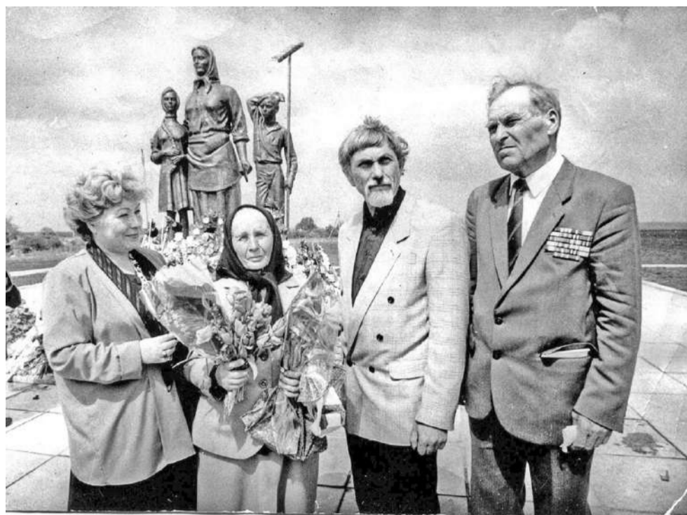
Открытие памятника Вдове и Матери Солдата. 1995 г.

Наш город стоит на гигантском железорудном месторождении. И поэтому на первом месте находится промышленность, в основном, горнодобывающая. Но и в промышленном районе не последнюю роль играет сельское хозяйство. Ведь чаще всего с понятием района ассоциируются именно сельское хозяйство, растениеводство и животноводство, труженики села. Успехи в развитии и благоустройстве Губкинского района не раз были отмечены наградами, многие села признавались самыми благоустроенными в Белгородской области.